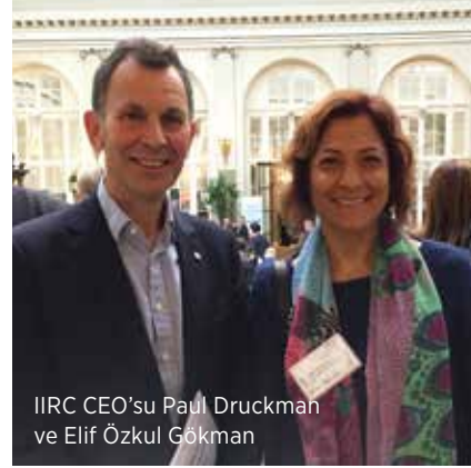
IIRC CEO'su Paul Druckman ve Elif Özkul Gökmen

IIRC'nin raporlama sürecini kolaylaştırmaya yönelik araçlarının da tanıtılması ile desteklendi. IIRC'nin özellikle üzerinde durduğu The Dialogue Landscape Map, dünyadaki tüm raporlama girişimlerinin entegre raporlama bakış açısından incelendiği, hedef, kapsam, içerik unsurlarıyla karşılaştırıldığı online bir harita. Buna ek olarak IIRC ekibi tarafından hazırlanan raporlama rehberi ve yönetim kurulları için değer yaratma konulu dokümanları IIRC web sitesinde yer alıyor. Bugün dünyada 1.000'e yakın firma entegre raporlamaya geçiş yapmış bulunuyor. Bunların yaklaşık 200'ü Japonya'da yer alıyor. IIRC'nin yaptığı bir araştırmaya göre CEO, CFO ve COO'ların yüzde